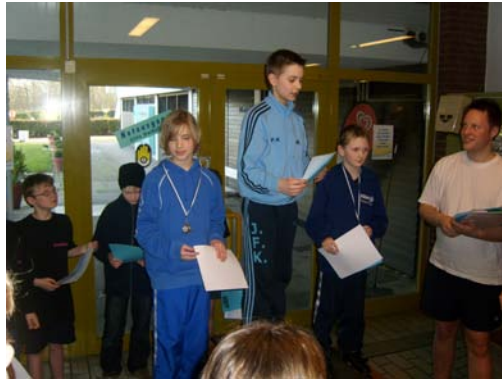
Siegerehrung Jahrgang 1998 männlich