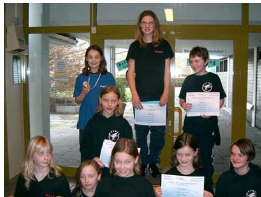
Siegerehrung Jahrgang 1998 weiblich