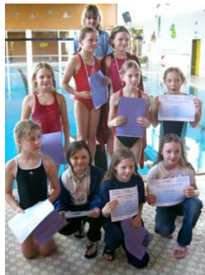
Siegerehrung Jahrgang 2000 weiblich