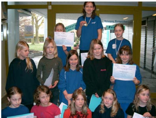
Siegerehrung Jahrgang 1999 weiblich