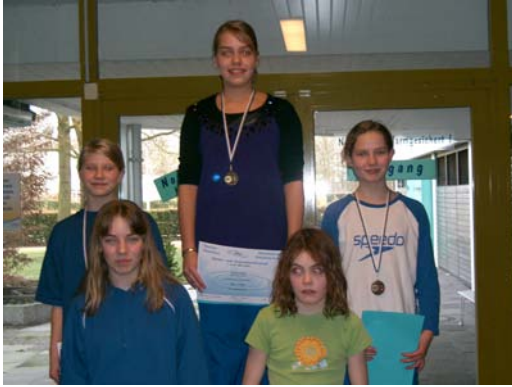
Siegerehrung Jahrgang 1997 weiblich