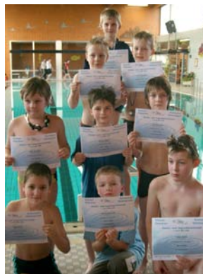
Siegerehrung Jahrgang 2000 männlich