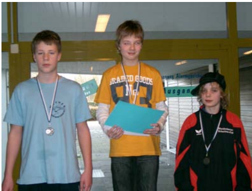
Siegerehrung Jahrgang 1997 männlich