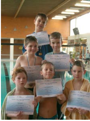
Siegerehrung Jahrgang 1999 männlich