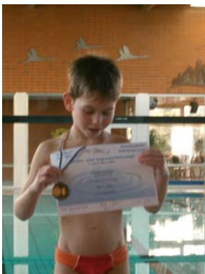
Siegerehrung Jahrgang 2001 männlich