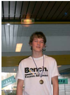
Siegerehrung Jahrgang 1996 männlich