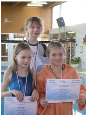
Siegerehrung Jahrgang 2001 weiblich